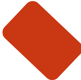
Terracota Código 502